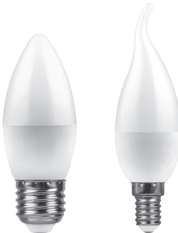
Арт. 25936, 25937, 25938

Светодиодная лампа Feron LB-570 – это современный аналог ламп накаливания и компактных люминесцентных ламп.